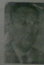
Milletvekilimiz Süleyman Çığır