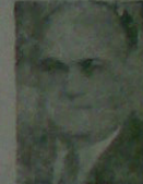
Milletvekilimiz Nazım Batur