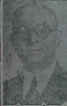
D. P. Genel Başkanı C. Bayar