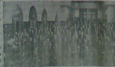
Büyük Millet Meclisinde toplanmadan bit